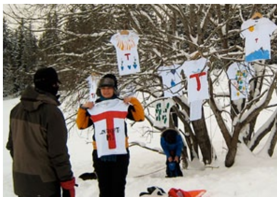
høyt henger de: t-skjorter med den velkjente røde T som motiv del ble like godt utstilt i et tre.

lement. Dette skulle helst ha noe å gjøre med det å gå på tur. Men viktigst var elevene fantasi. Derfor ble det rom for både Eiffeltårnet, en sjiraff, en moped ... - og veldig mye annet artig. Lærer Peter Sutton bar så