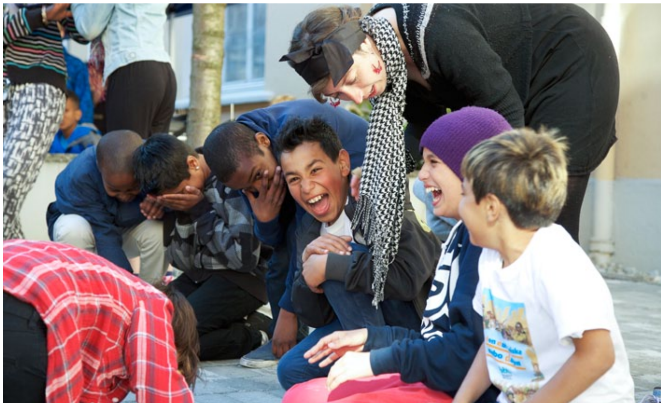
improvisasjonsteater: Frigruppe engasjerer barn og ungdom på gatefesten.