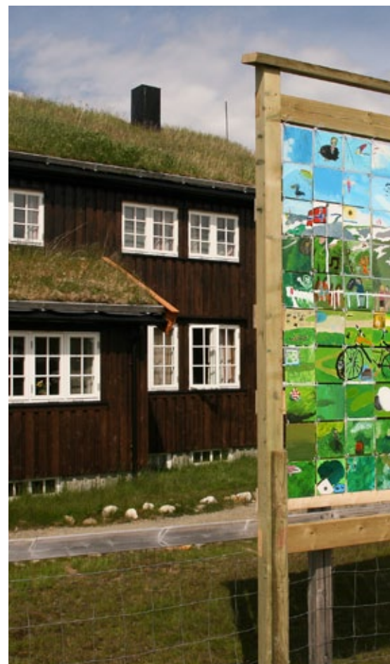
mosaikk til fjells: 45 kulturskoleelever skapte dette mosaikkbildet av og ved Jøldalshytta i Trollheimen.

Og det har blitt laget tegninger av nye turisthytter, hvor utgangspunktet for hver hytte var foto av to ulike vinduer. Det har vært andre naturrelaterede tegneoppgaver samt et bokbindingsprosjekt, is- og snøskulpturering har også stått