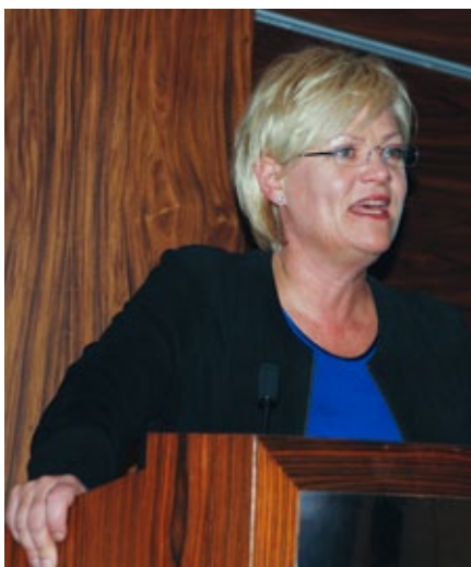
statsråd kommer: Kunnskapsminister Kristin Halvorsen gjør som i fjor; holder innlegg på Norsk kulturskoleråds landsmøte.